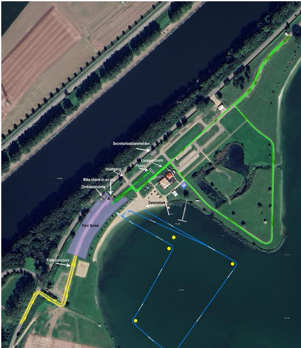
Bijlage 1: evenementen terrein Standaard & Sprint Afstand